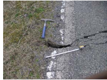
(金沢大学理学部地球学科 能登半島地震関連ページより)