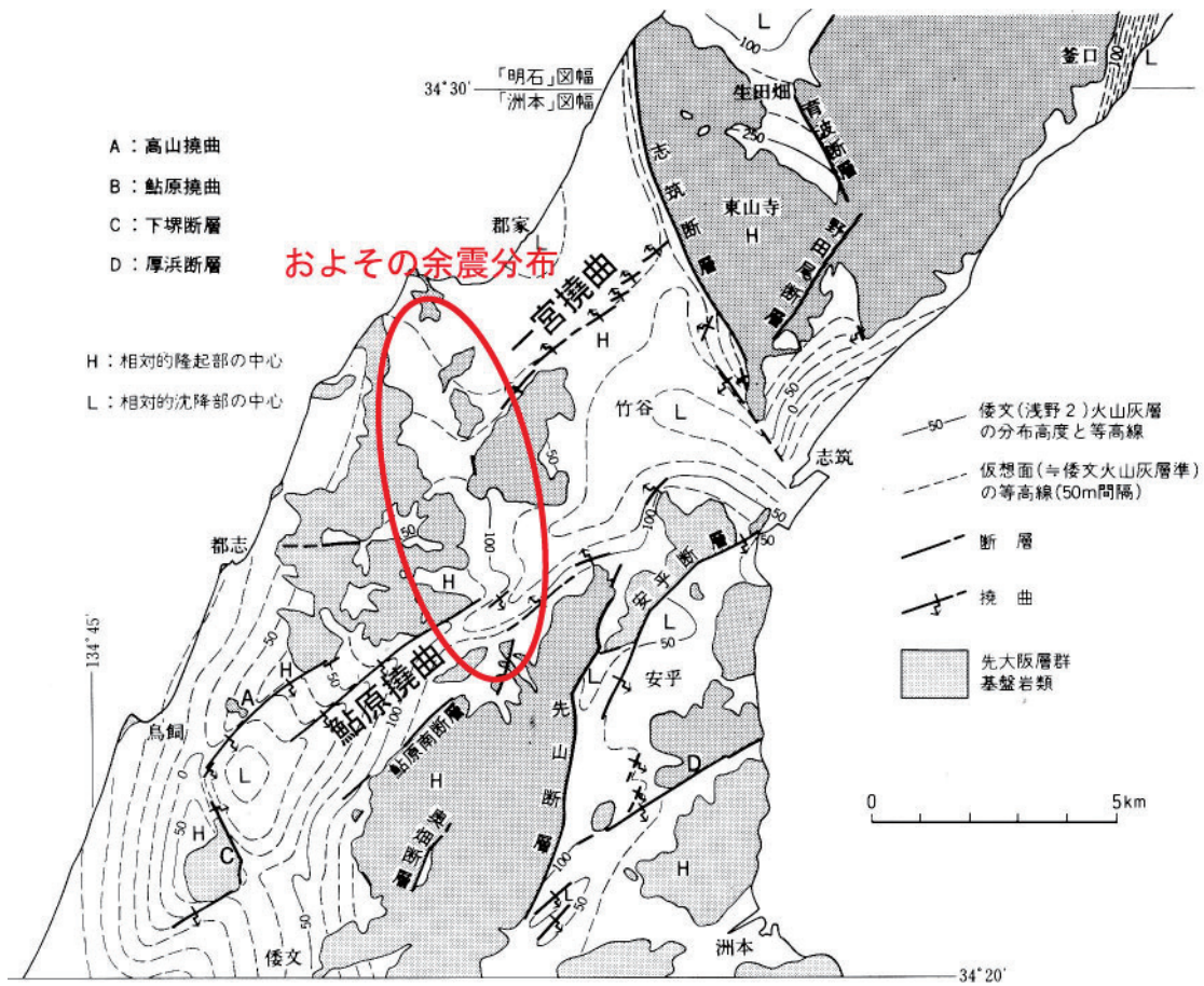
第2図 「洲本」図幅地域における断層・撓曲の分布と大阪層群の地質構造概念図 1) 。 余震分布範囲を追記。