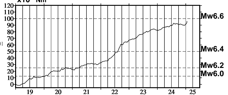
モーメント* 時系列 (試算)