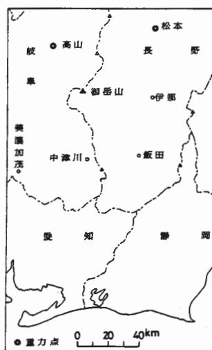
第1図 御岳山周辺の重力測量結果