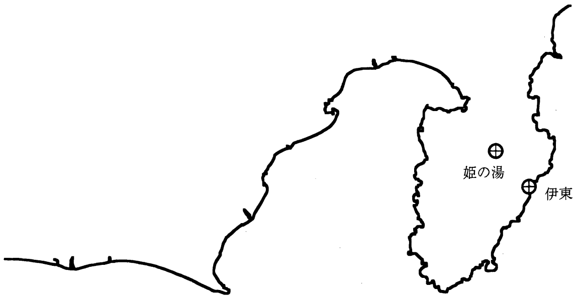
第1図 伊豆地域のラドン濃度および自噴量観測地点