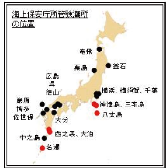
第1図 海上保安庁所管の験潮所で観測された津波の到着時刻(日本時間)と高さ。験潮所の位置を右図に示す。 Fig.1 Arrival times(JST) and heights of tsunami observed at the tidal stations of Japan Coast Guard. The positions of the stations are shown in the right figure.